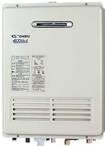
停電時自立型高効率ガスふろ給湯器 GFK-S2430WKA-1セット